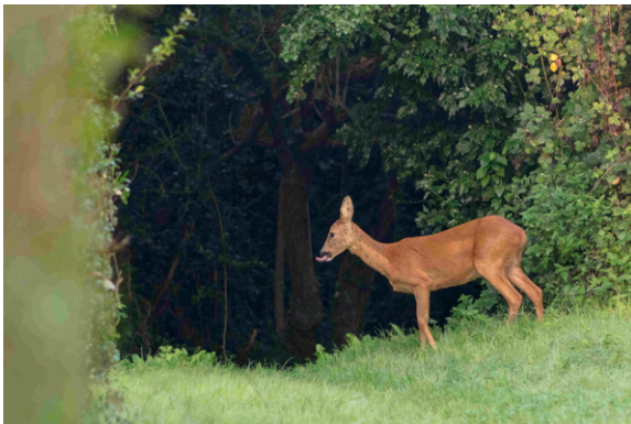
Photo prise en 2021 sur le site du Bois d'à côté